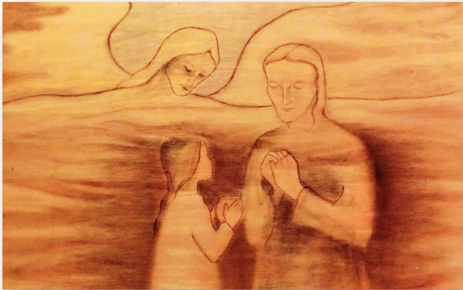
Illustratie: Julië Fichter